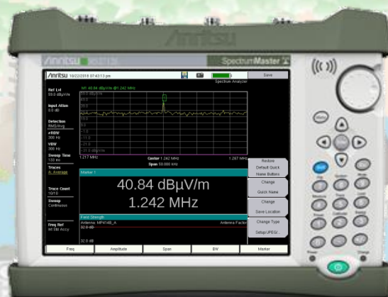
MS271xE Spectrum Master スペクトラムマスタ